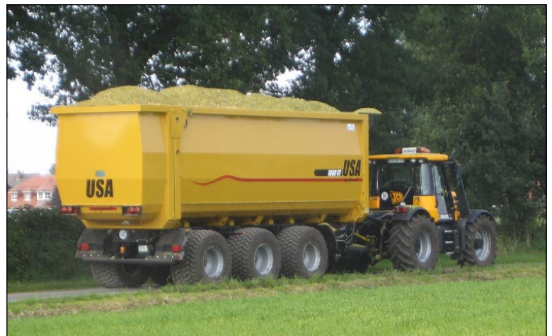
Im Bereich Transporttechnik arbeitet Agrotec mit dem Unternehmen USA Equipment zusammen. Im Sortiment finden sich Abschleppwagen bis 60 m 3 , die Grassilage bis zu 50 % zwischenverdichten können.