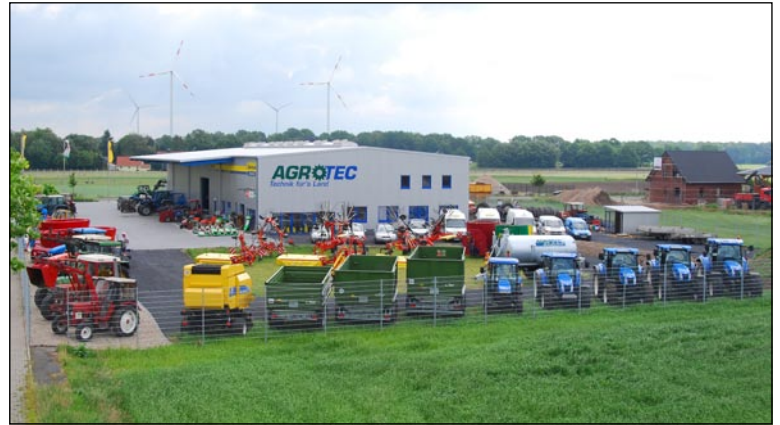
Um 2000 m 2 wurde das Agrotec-Gelände in Raesfeld erweitert. Der neue Teil dient als Ausstellungs- und Präsentationsfläche.